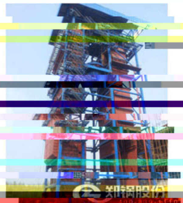
150吨流化床电站锅炉安装现场图片

郑锅五星级的售前、售中、售后服务完美诠释了“心服务，星体验”的服务理念，使得河北东光150吨流化床电站锅炉的安装平稳高效实施。在河北东光150吨流化床电站锅炉后续的安装进度中，郑锅继续在官网“服务支持—跟踪服务”栏目、官方微信、微博详细介绍，同时您还可以拨打全国免费咨询热线400-839-1110了解更多美轮美奂服务体系。